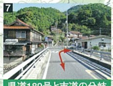
県道189号と市道の分岐