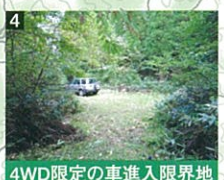
4WD限定の車進入限界地

林道と歩道の分岐点から約1.1kmの場所で、車道程度のスペースがある。この間は急勾配の砂利道で道が悪く、草刈りが完了していても乗用車の進入は困難。打原峠まで約700m。