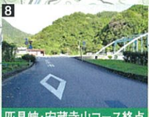
匹見峡・安蔵寺山コース終点