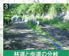
林道と歩道の分岐

津和野町・吉賀町に抜けることができるが、積雪期に除雪をしないので注意が必要。この林道沿いに安蔵寺トンネル登山口、滑峠登山口がある。